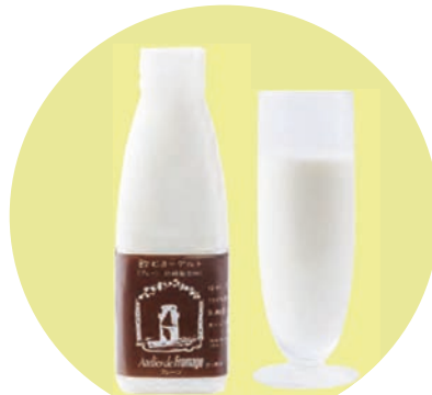
飲むヨーグルト (プレーン) 500ml

優しい甘さでコクがあるのに後味はすっきり。飲みやすい甘さで、お子様にも人気です。