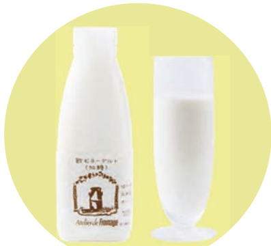
飲むヨーグルト (加糖) 500ml

優しい甘さでコクがあるのに後味はすっきり。飲みやすい甘さで、お子様にも人気です。