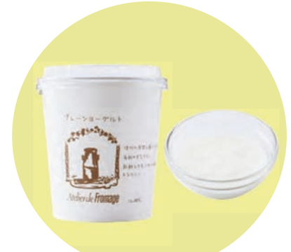
プレーンヨーグルト 400g